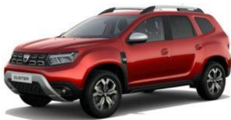
DUSTER 4x2 ou 4X4