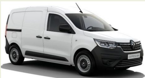
Kangoo Express Tce 100cv GNV