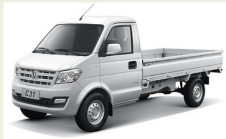
Gladiator 1.5 100cv plateau (Exemple : Benne basculante)