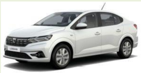
Logan 3 Tce 90 GNV