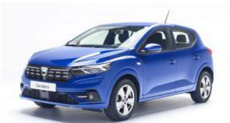
Sandero 3 Tce 90 / Sandero Stepway