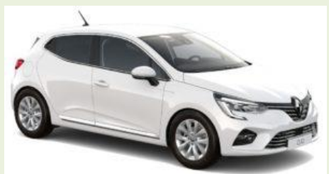
Clio V Tce 90